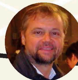
Dominique Fataccioli Metteur en scène, scénographe, auteur